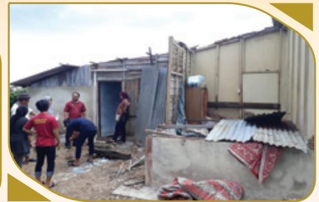
SKUAD PRIHATIN ASNAF MAIPK MENZIARAHI MANGSA RIBUT DI GUGUSAN MANJOI PADA 7 JANUARI 2019