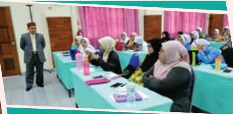
Hospital Bahagia Ulu Kinta 27 Mac 2019