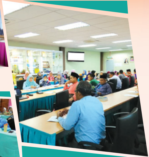
MRSM Sultan Azlan Shah, Kuala Kangsar 22 Februari 2019