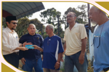
SERAHAN BANTUAN SEGERA TUNAI KEPADA MANGSA KEBAKARAN DI KG. SEMAT, MANONG PADA 30 JANUARI 2019