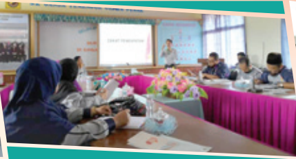
SK Ganda Temengor, Gerik 20 Februari 2019