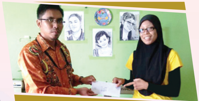
PENYERAHAN BANTUAN MESIN JAHIT KEPADA ASNAF DI KUALA BAGAN TIANG PADA 13 DISEMBER 2018