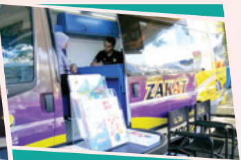
Karnival Sambutan Jubli Emas Masjid Sultan Idris Shah II (Masjid Negeri Perak), Ipoh 11-13 Januari 2019