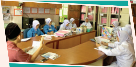
Klinik Kesihatan Ibu & Anak (KKIA) Selama, 4 Mac 2019