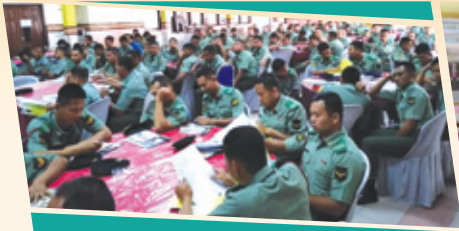
Pusat Latihan Kor Perkhidmatan (PULMAT), Kamunting 1 Februari 2019